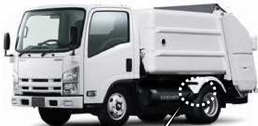
車枠内側から見た図