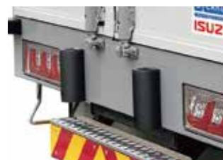
リヤクッションゴム