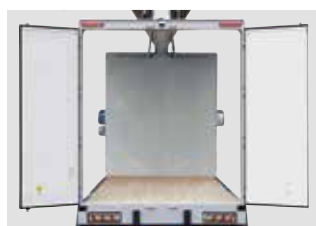
リヤドア開口部(幅広仕様)