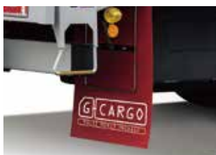
リヤ独立マッドフラップ