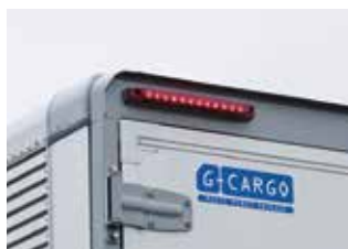
車高灯&ストップランプ(リヤ)