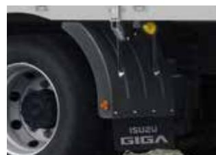
フェンダー(樹脂製) *写真は日本トレス製