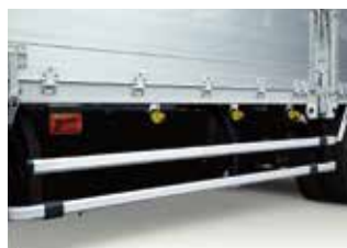
サイドバンパー(アルミ製)