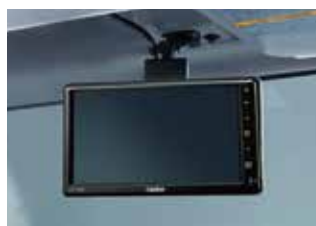
バックアイモニター