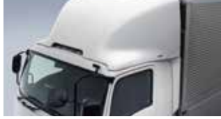
エアディフレクター+ギャップシールド(23A)