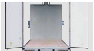
リヤドア開口部(幅広仕様)