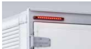
リヤ車高灯&ストップランプ(LED)