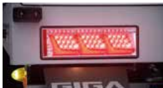
LEDリヤ3連コンビランプ