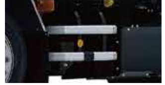
サイドバンパー(アルミ製) *写真はCNG車