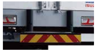
リヤクッションゴム