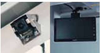
バックアイカメラ+カラー液晶モニター