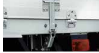
アオリ開閉補助装置