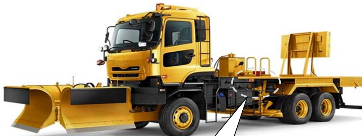
駐車ブレーキ用エアプレッシャーセンサ