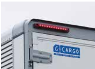
車高灯&ストップランプ(リヤ)