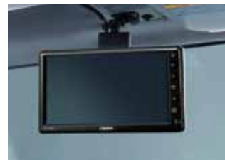
バックアイモニター