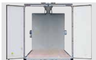
リヤドア開口部(幅広仕様)