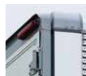
エアロ形状リヤ門構