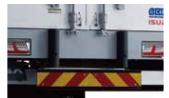
リヤクッションゴム