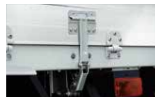
アオリ開閉補助装置