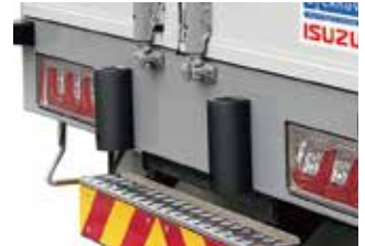
リヤクッションゴム