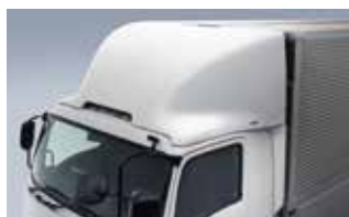
エアディフレクター+ギャップシールド(23A)