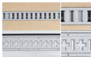
ラッシングレール