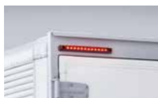
リヤ車高灯&ストップランプ(LED)