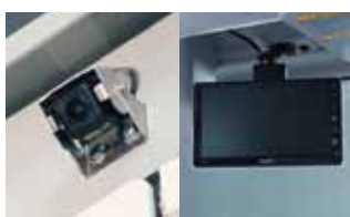
バックアイカメラ+カラー液晶モニター