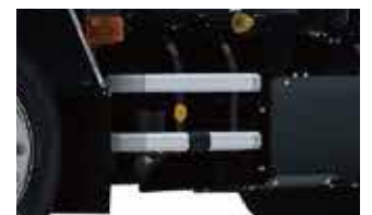
サイドバンパー(アルミ製)