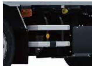
サイドバンパー(アルミ製)*写真はCNG車