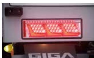
LEDリヤ3連コンビランプ