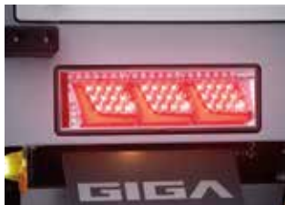
LEDリヤ3連コンビランプ