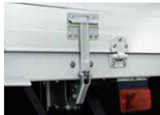
アオリ開閉補助装置