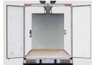
リヤドア開口部(幅広仕様)