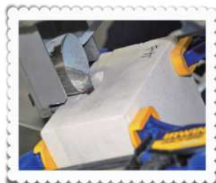
鋳型(いがた)に溶けた金属を流し入れる