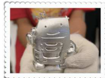
できた鋳物(いもの)を磨く