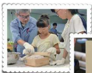
キャラクターの型に砂を込めて鋳型(いがた)を作る