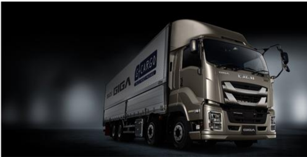
ギガ G カーゴ

いすゞ自動車株式会社(本社：東京都品川区、社長：片山正則、以下「いすゞ」)は、大型トラック「ギガ」、中型トラック「フォワード」、小型トラック「エルフ」のいすゞ自動車創立80周年記念特別仕様車を、あす10月25日より全国一斉に発売します。