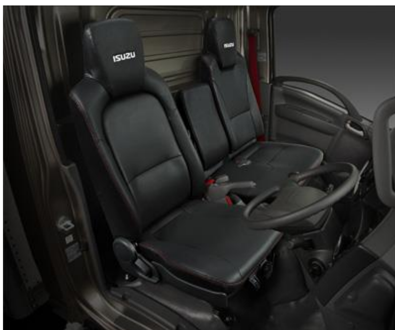
エルフ インテリア