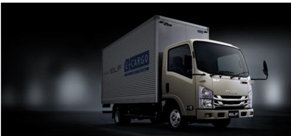
エルフ E カargo