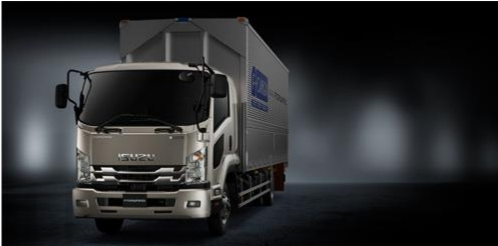
フォワード F カargo

すぐれた性能や使い勝手はそのままに、今回だけのプレミアムな装備を施したいすゞ自動車創立 80 周年記念特別仕様車は、そのインテリア・エクステリアを 10 月 27 日から開催される第 45 回東京モーターショー2017 いすゞブースにてご覧いただけます。※