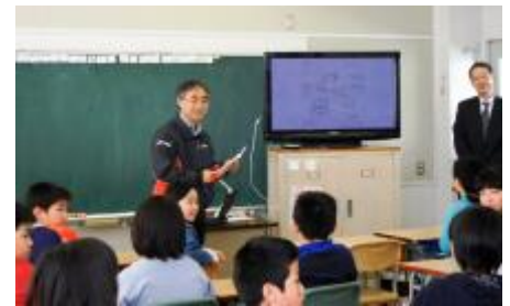
トラックのデザイナーによる児童たちの絵の講評

児童たちは、普段見慣れないハイブリッドバスやミドルムシで走る未来のDeuSEL®トラックのデザイン画に興味津々で、自分たちの絵に添えられたコメントにもとても喜んでくれました。