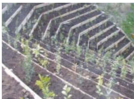
緑化研究活動支援