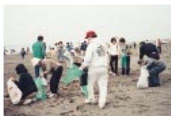
ビーチクリーンアップ