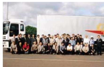
E & S 走行会