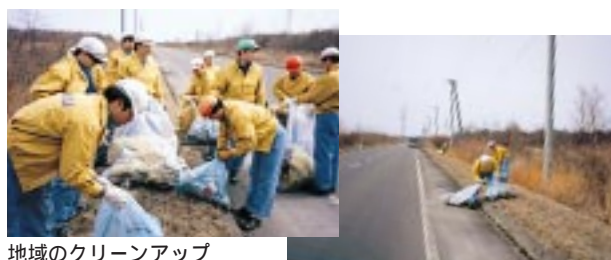
地域のクリーンアップ