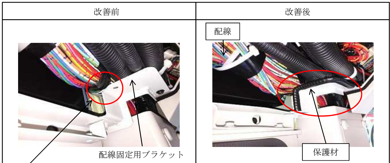
基準不適合発生箇所

大型路線バスにおいて、運転者席上側配電箱内の配線の配索が不適切なため、配線が固定用ブラケットの端部と干渉するものがある。そのため、そのまま使用を続けると、配線の被覆が損傷して短絡し、最悪の場合、扉が開閉できなくなるおそれがある。